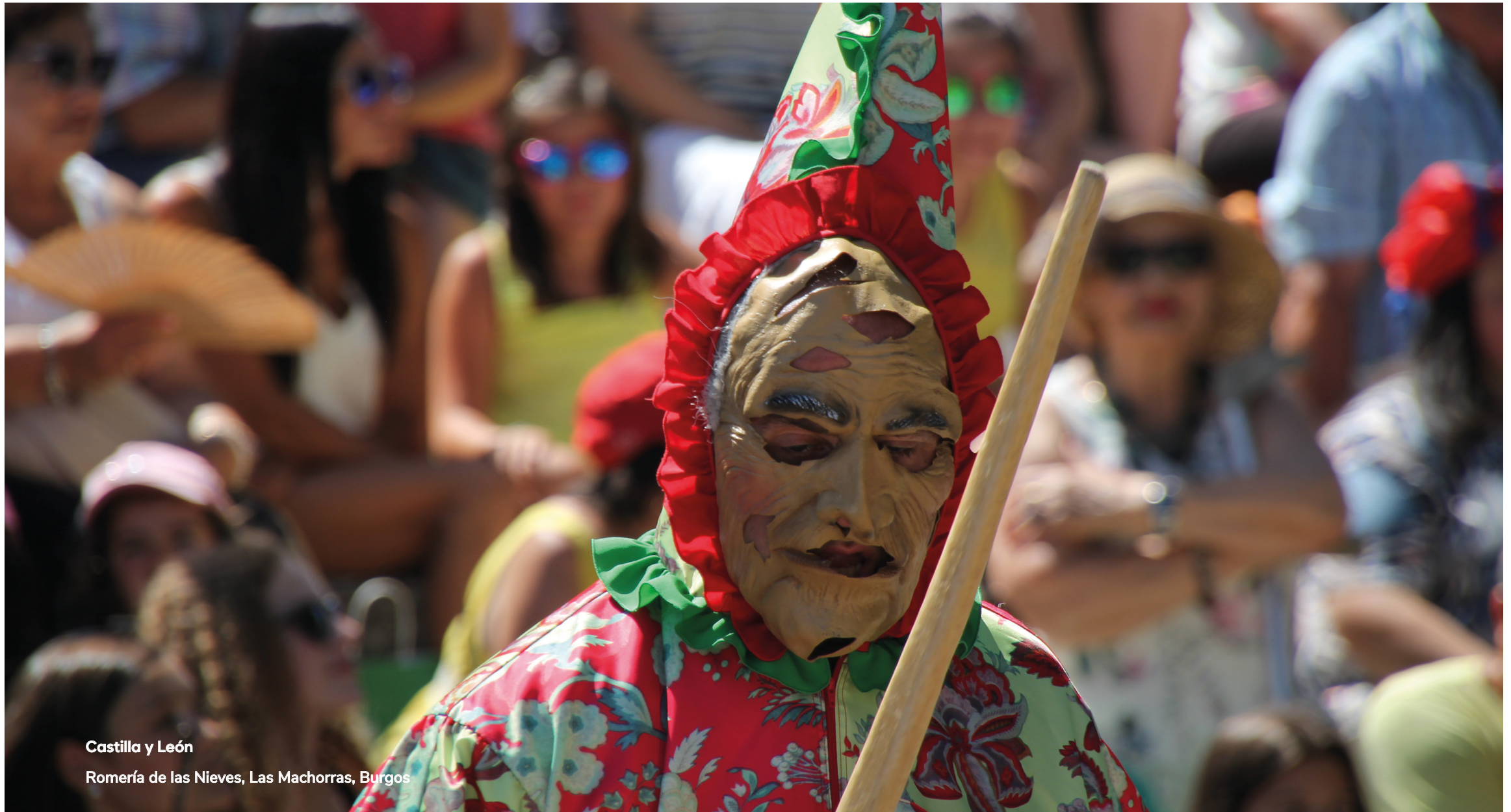
Castilla y León Romería de las Nieves, Las Machorras, Burgos