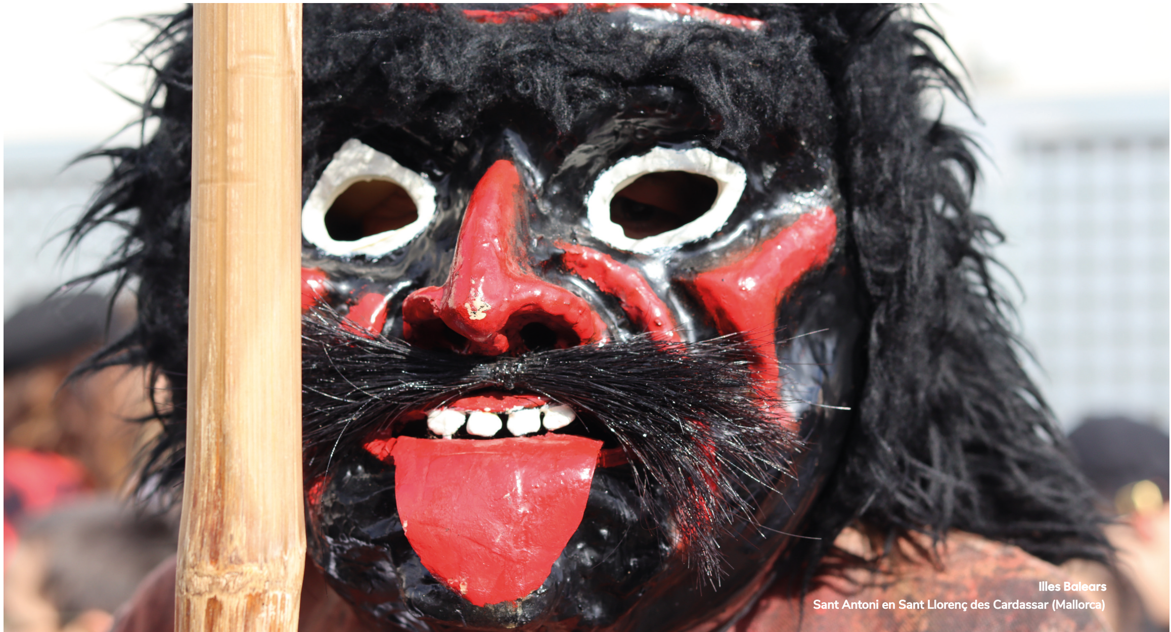
Illes Balears Sant Antoni en Sant Llorenç des Cardassar (Mallorca)