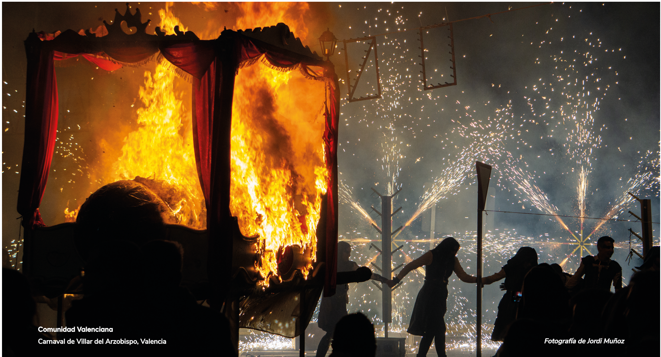
Comunidad Valenciana Carnaval de Villar del Arzobispo, Valencia