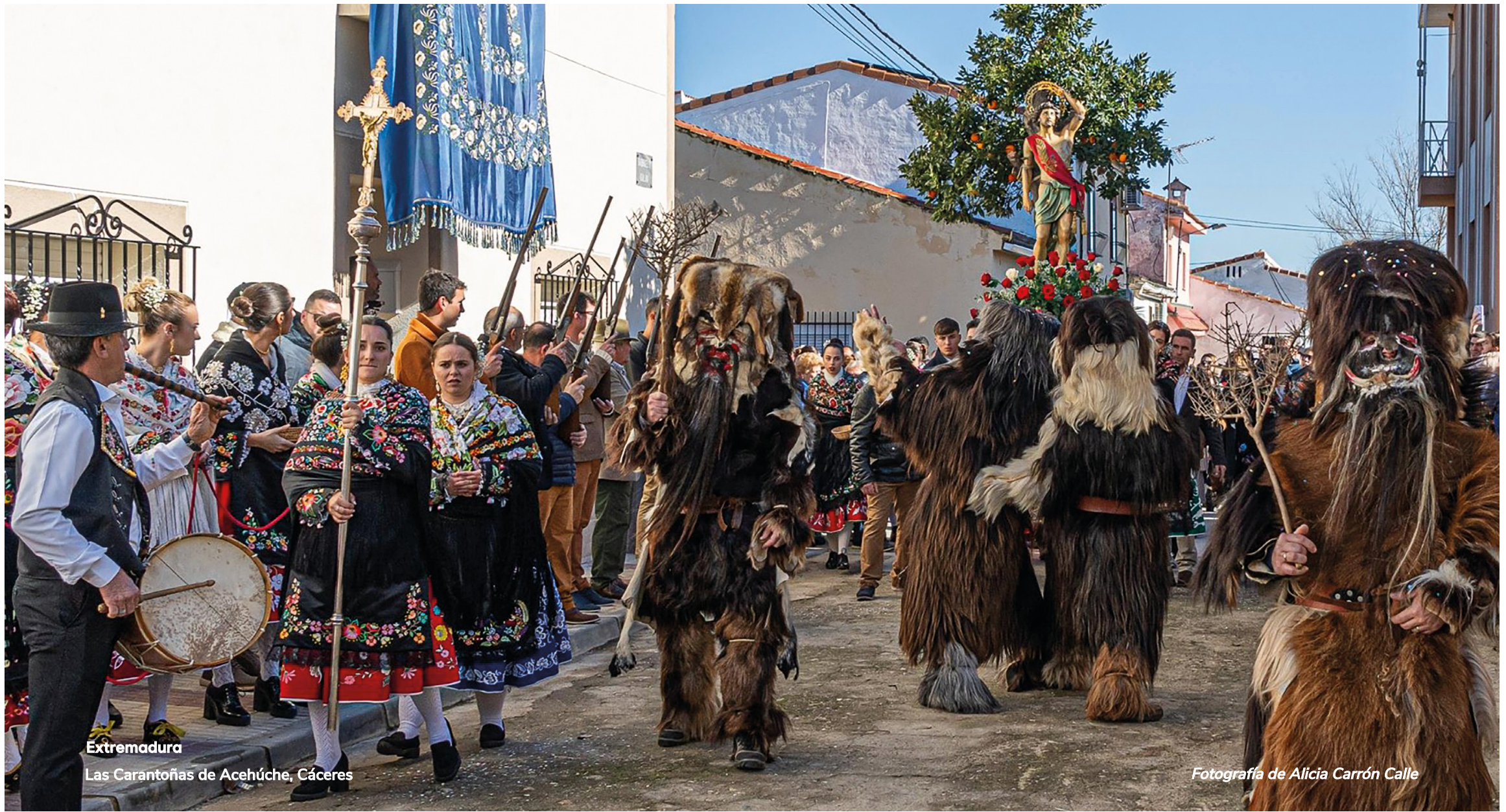
Extremadura Las Carantoñas de Acehúche, Cáceres