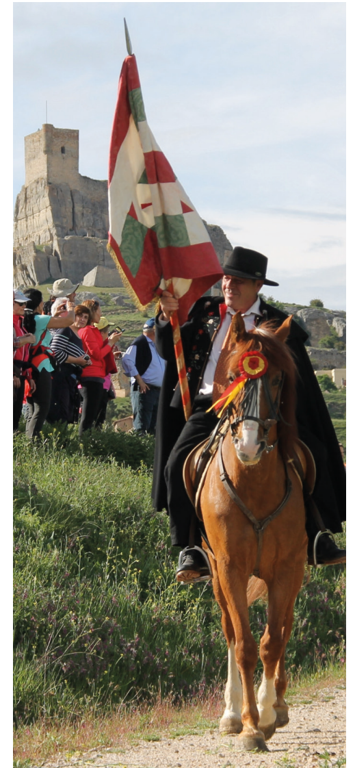
Fotografía de Pablo Espartosa