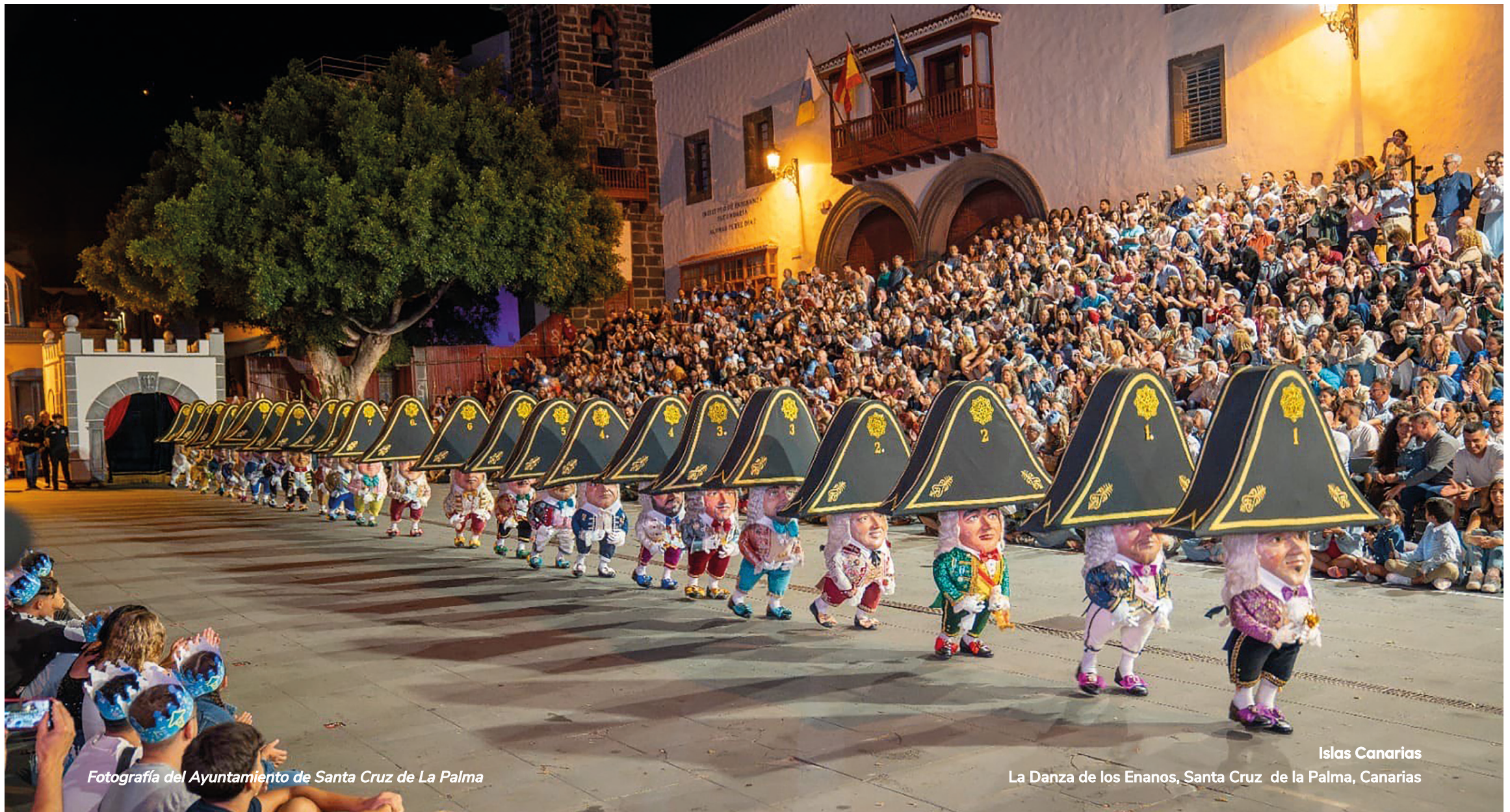
Fotografía del Ayuntamiento de Santa Cruz de La Palma