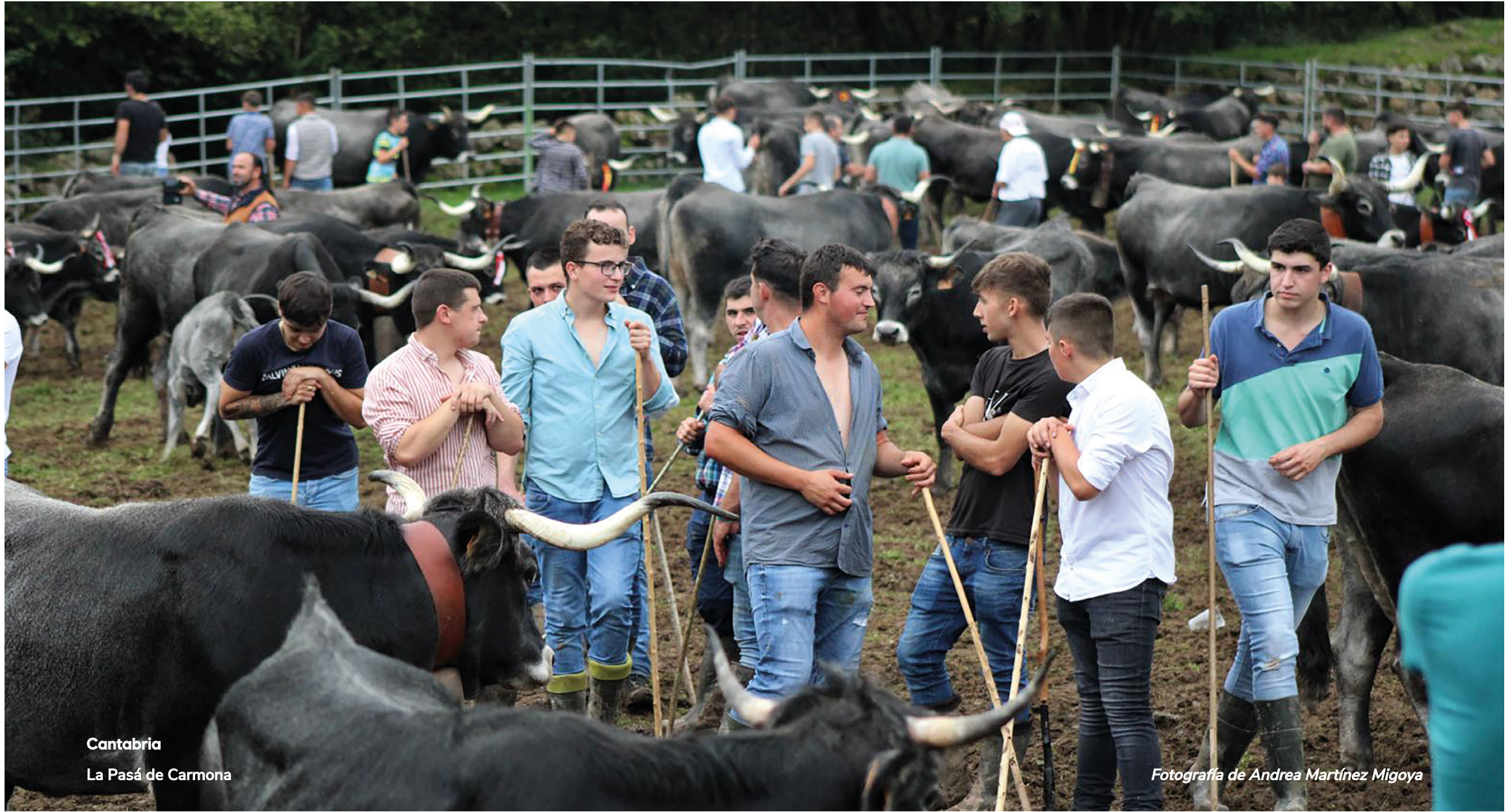
Cantabria La Pasá de Carmona