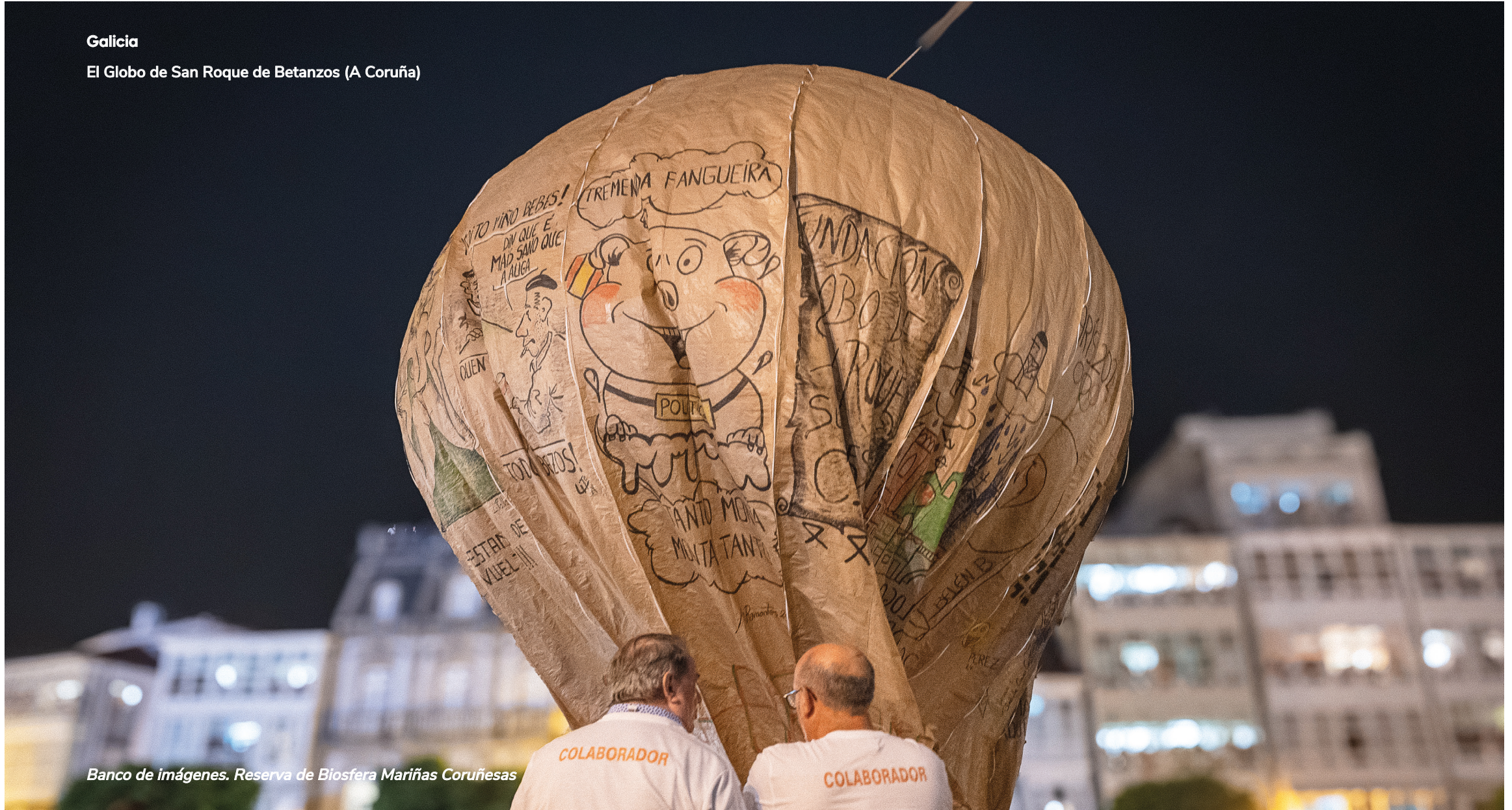
Banco de imágenes. Reserva de Biosfera Mariñas Coruñesas

El Globo de San Roque de Betanzos (A Coruña)