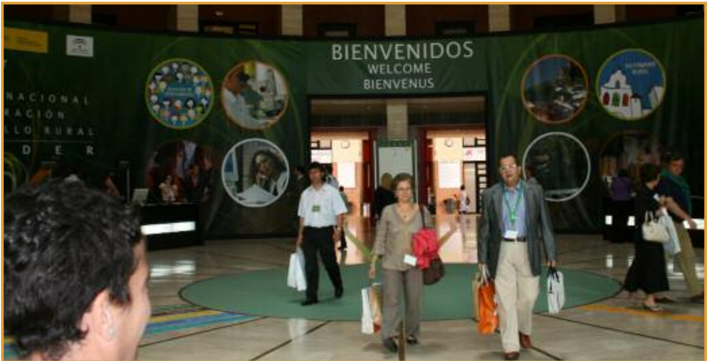
Acceso principal al FICODER, que se celebró en el Palacio de Congresos de Sevilla.