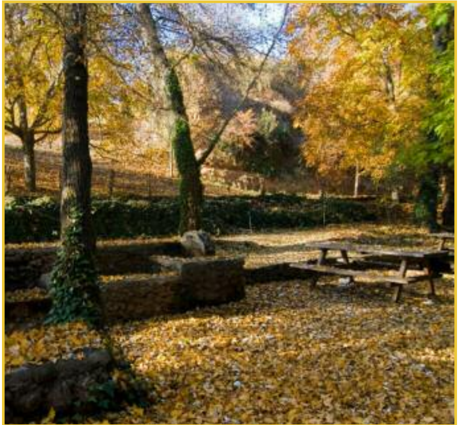
Puesta en valor del monte para uso recreativo.

En esta línea, uno de los objetivos de la Ley es "conservar y recuperar el patrimonio y los recursos naturales y culturales del medio rural a través de actuaciones públicas y privadas que permitan su utilización compatible con un desarrollo sostenible".