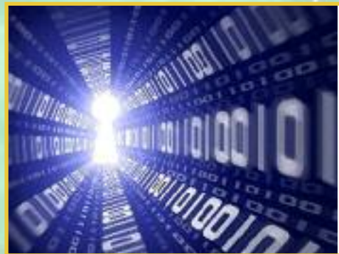
La brecha tecnológica en el mundo rural 20

toda la información sobre desarrollo rural, al día en