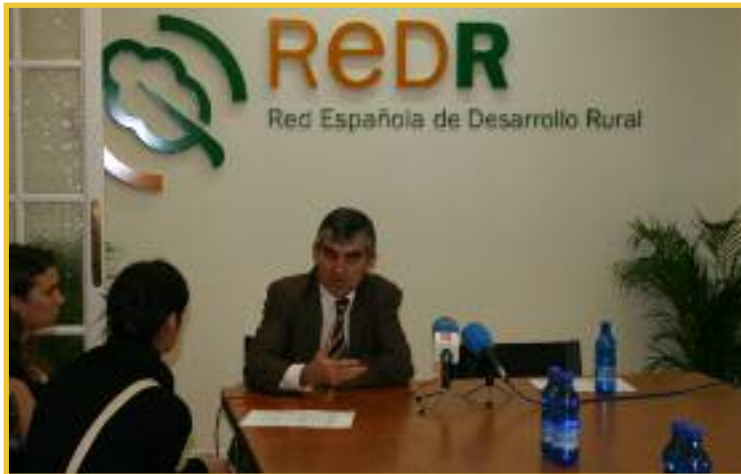
Eduardo Alvarado, presidente de la Confederación Hidrográfica del Guadiana, en la sede de la Red Española.

Ribera de Navarra (Navarra). Acondicionamiento del margen derecho del río Arga a su paso por Peralta. Se acondicionó un paseo peatonal de 3 kilómetros llanos, adaptados para discapacitados.