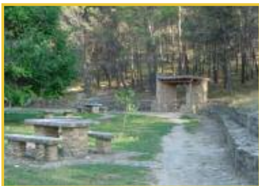
Medio Ambiente y medio rural 2